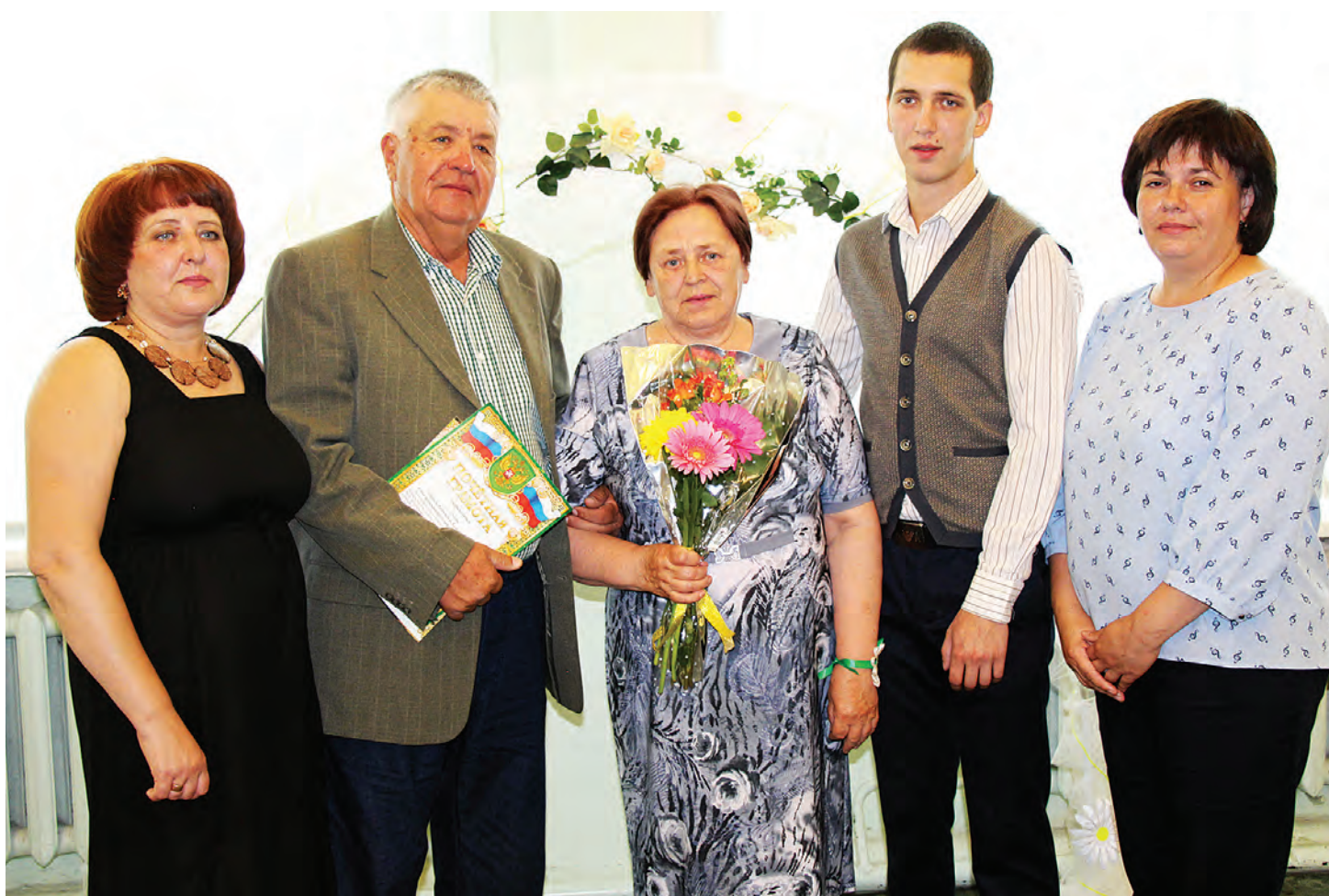
Юбиляры Пудовы в кругу родных людей.