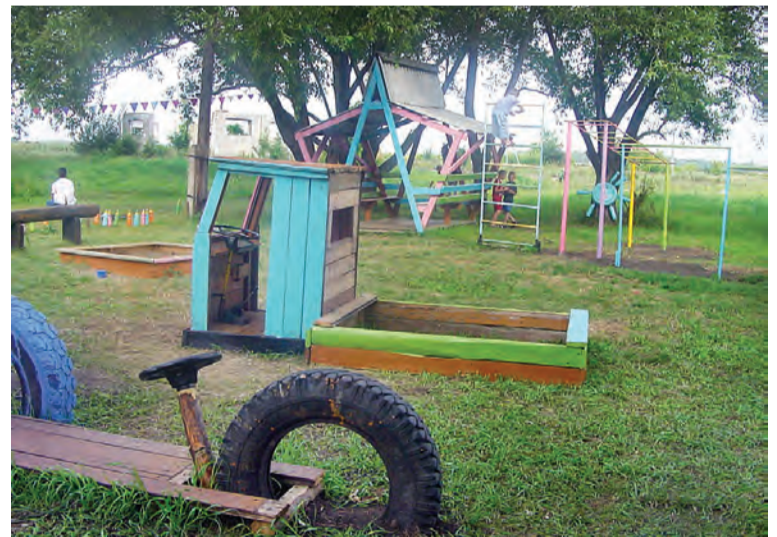
Как же хорошо теперь на детской площадке!