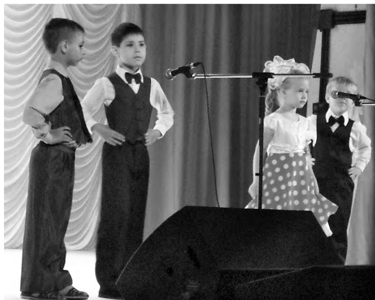
Звучат поздравления от воспитанников Марьяновского детского сада №2.