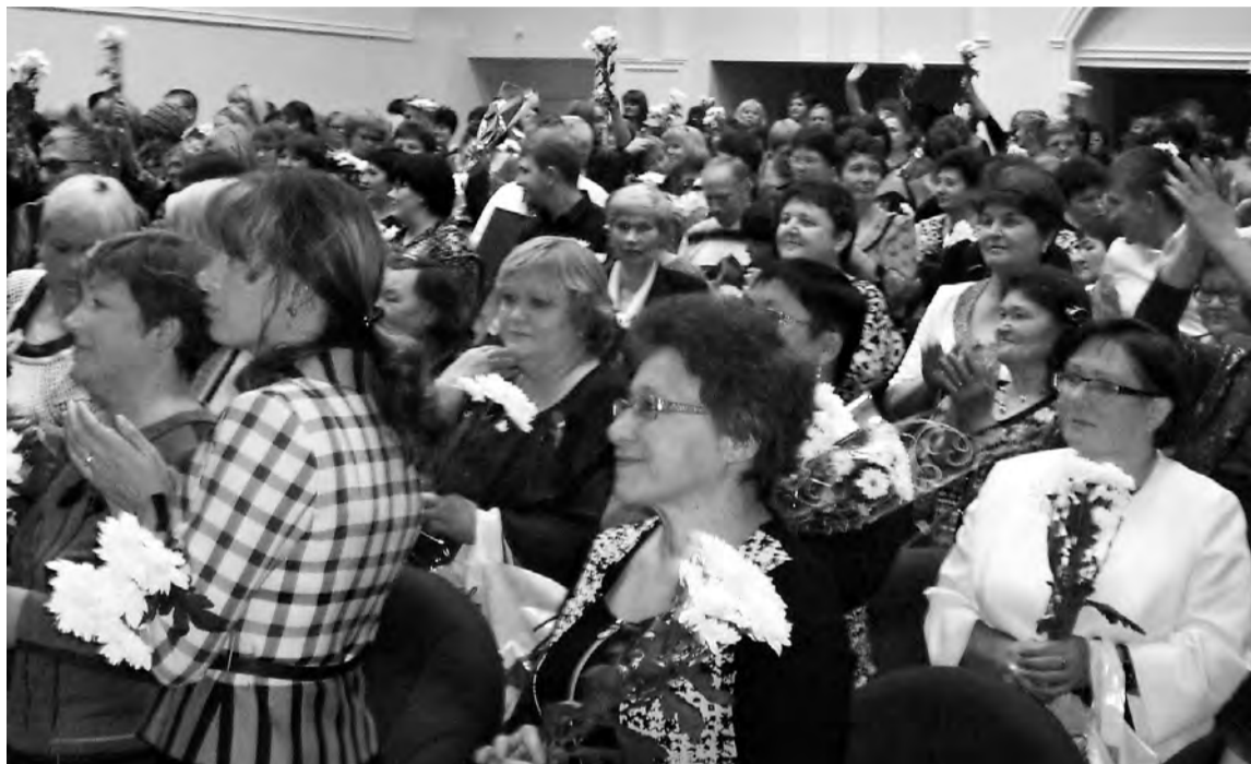
Так хотелось, чтобы искренний, теплый и волнующий праздник не заканчивался...

Среди виновников торжества на этот раз в зале были и педагоги, чей труд отмечен по-особому: за заслуги перед нашей областью в развитии образования звания «Заслуженный работник образования Омской области» был удостоен директор Москаленской средней