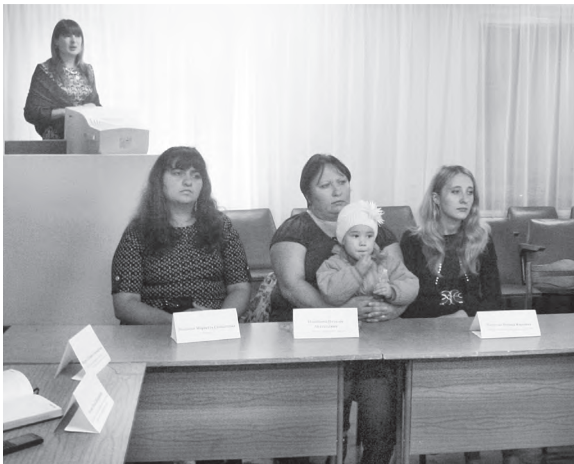
Переговорная площадка собрала всех неравнодушных.

из сел района станут в этом году воспитанниками «Мобильного детского сада». А всего в реализации проекта примут участие более 70 человек. В их числе родители, педагоги Марьяновского ЦДТ, заведующие сельскими клубами и учителя школ.