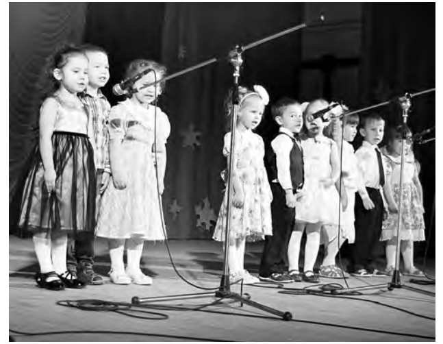
Поздравления от малышей Марьяновского детского сада №2.