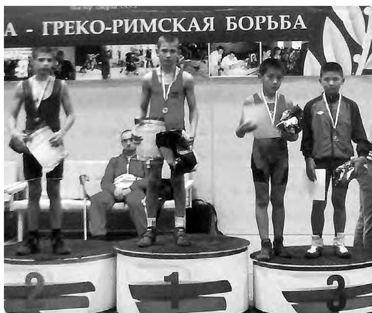
На пьедестале межрегионального турнира в Томске.