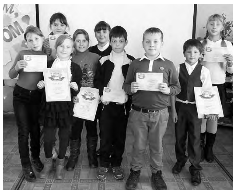
Победители конкурса «Поздравь библиотеку».