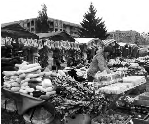
Зима жителей омского региона врасплох не застанет.