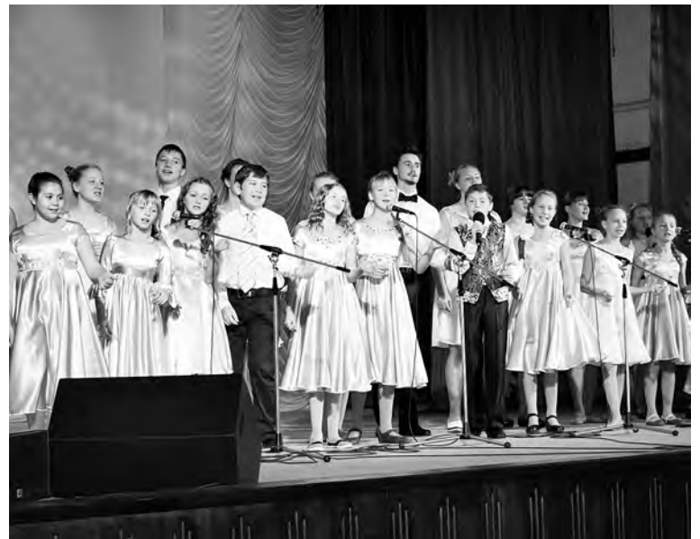
Звучит песня в исполнении театра песни «Поющие сердца».