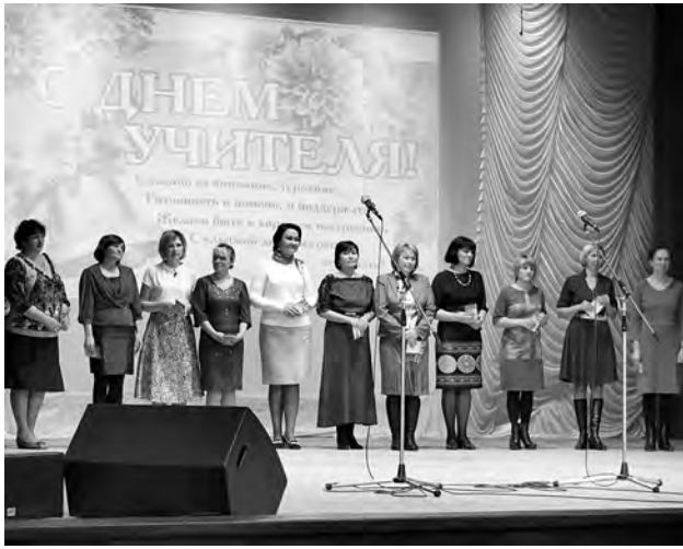
25 педагогов района встретили в этом году четверть века своей трудовой деятельности.