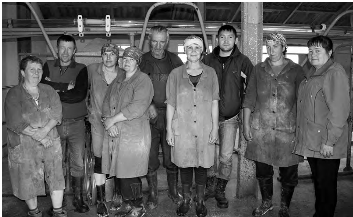
Группа животноводов Васильевского отделения на вечерней дойке 9 июля.

составляет удой на фуражную корову в целом по ОАО «Племенной конный завод «Омский» на 10 июля текущего года, что выше прошлогоднего показателя на 0,84, и это самый высокий результат по району.