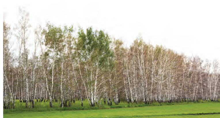
Так удручающе выглядят пока наши леса.

Взгляни, как говорится, налево, взгляни направо... И по всей округе взору предстанет картина безлиственных лесов. Такое их состояние представляет жалкое зрелище на территориях нескольких поселений района. Листва уничтожена непарным шелкопрядом. Население обеспокоено такого рода ситуацией.