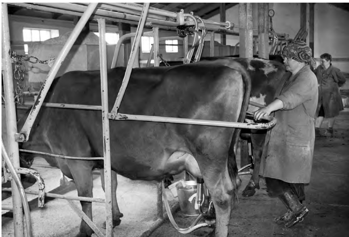
Идет процесс дойки.