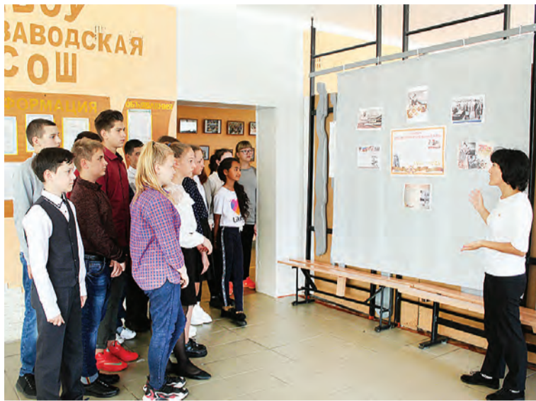
Утро 2 сентября в Конезаводской школе началось с участия в общероссийской акции, посвященной 75-летию окончания Второй Мировой войны.

Эту памятную дату не оставили без внимания и в Марьяновских средних школах №1, 2, 3, в Заринской, Орловской, Пинетинской, Степинской, Боголюбовской, Москаленской и ряде других. А в Шарাপовской к участию в такой акции пригласили еще и гостей школы, побывавших в ней на Дне Знаний. Их вниманию была предложена экскурсия в школьный музей, где один из разделов за-