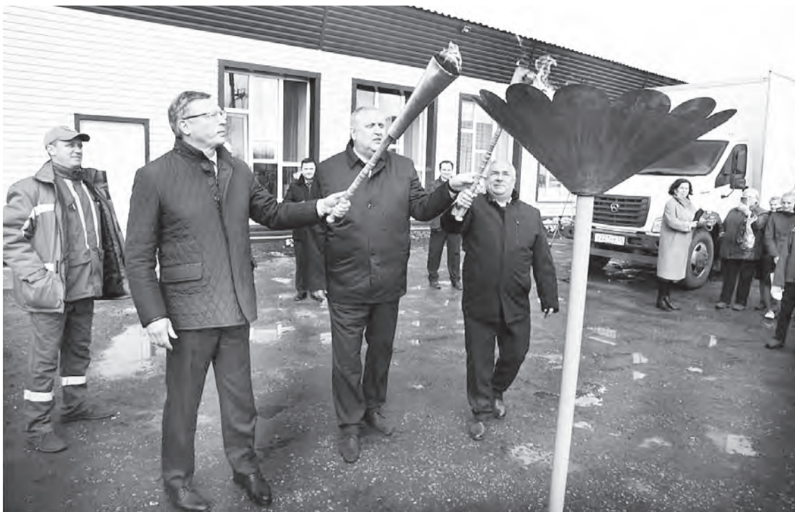
Газ в Аполлоновке ждали в начале зимы, но работы завершены досрочно.