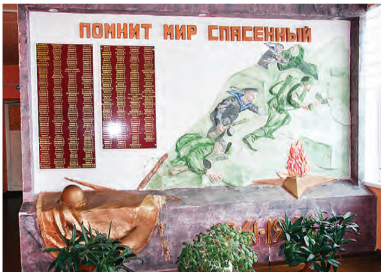
Вот такое оформление появилось в Москаленской школе к 75-летию Победы.

нимает экспозиция, посвященная 75-летию Победы, в которой широко позиционируется роль местного населения.