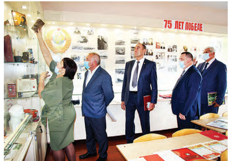
Экскурсия в музей Шарাপовской школы, организованная для гостей в День знаний.

из-за карантинных мер в весеннем учебном процессе не получилось на тот момент масштабно использовать данные экспонаты в проведении тематических мероприятий.