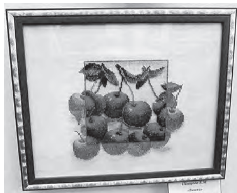
Комбинированная вышивка с бисером Елены Шевцовой – новый этап в развитии таланта.