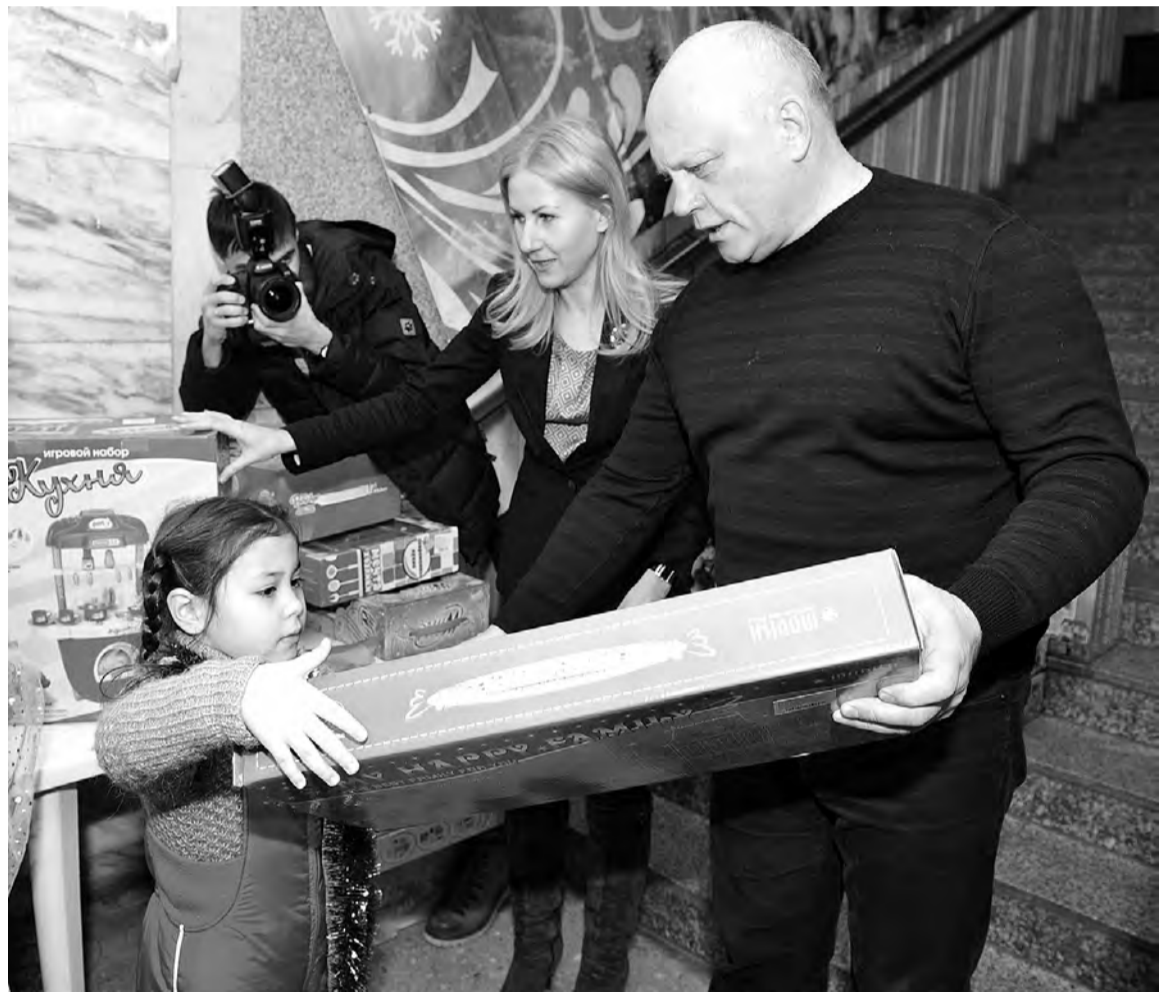
В предновогодние дни Губернатор области Виктор Назаров побывал на множестве различных мероприятий для детей, лично вручая им подарки.

- Общедорожный фонд в нашем бюджете составляет около четырех миллиардов рублей. На дорогу Омск-Тюмень выделены средства, чтобы привести в порядок 85 километров трассы. Но даже существующих денег не хватает – мы постоянно делим эту сумму как тришкин кафтан. Я знаю с десяток сел, которым просто необходимо сделать дорогу. На подобные просьбы прошу дать правительству немного времени. Мы обязательно выполним эту работу.