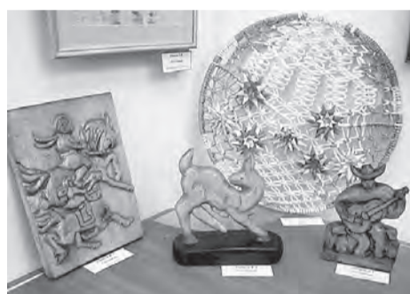
Впервые на выставке работы в технике резьбы по дереву Веры Литauer из Пикетного.