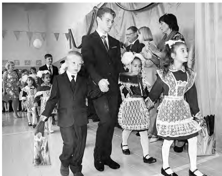
Под аплодисменты 13 первоклассников отправились в свой класс.