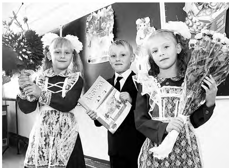
Первоклашки - главные герои праздника.