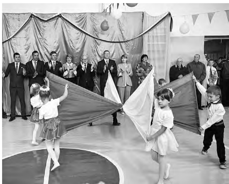
Праздничный подарок воспитанников Степнинского детского сада.