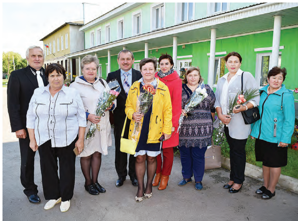
Много заслуженных наград ежегодно получают педагоги Москаленской средней школы, и этот раз не стал исключением.