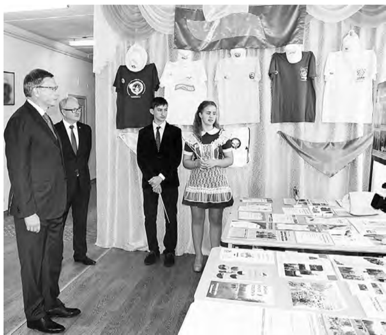
Глава региона с интересом ознакомился с выставкой эколого-краеведческого объединения «Дрофа».