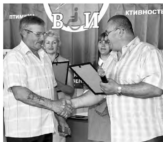
Благодарность за помощь в проведении мероприятия.