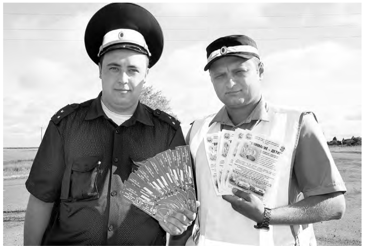
Большое внимание сотрудники ОГИБДД уделяют вопросам профилактики дорожного движения среди детей.