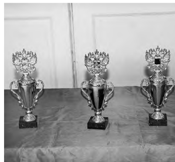
За призовые места - вот такие симпатичные кубки!