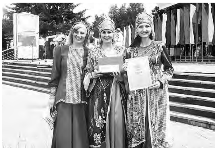
«Осенний сон» - призер областного конкурса «Поет село родное».