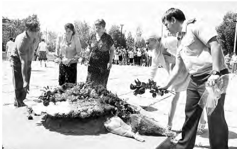
В День памяти и скорби.