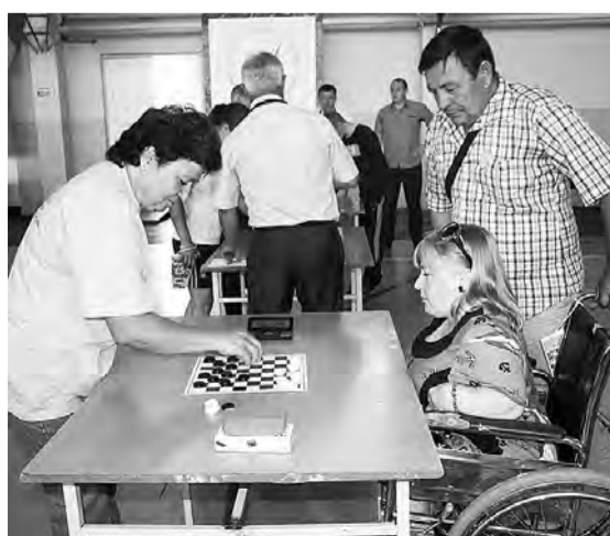
Один из видов состязательной программы - шашки.