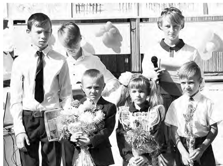
Главные на празднике - первоклассники.