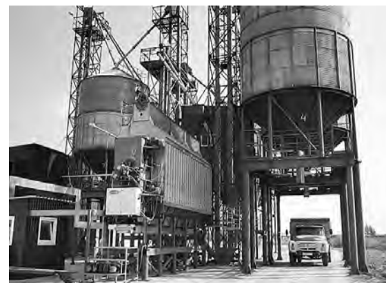
Второй сезон функционирует в хозяйстве современный сушильно-очистительный комплекс.