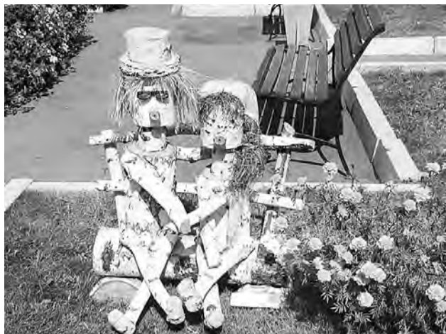
Творение Конезаводского Дома культуры.