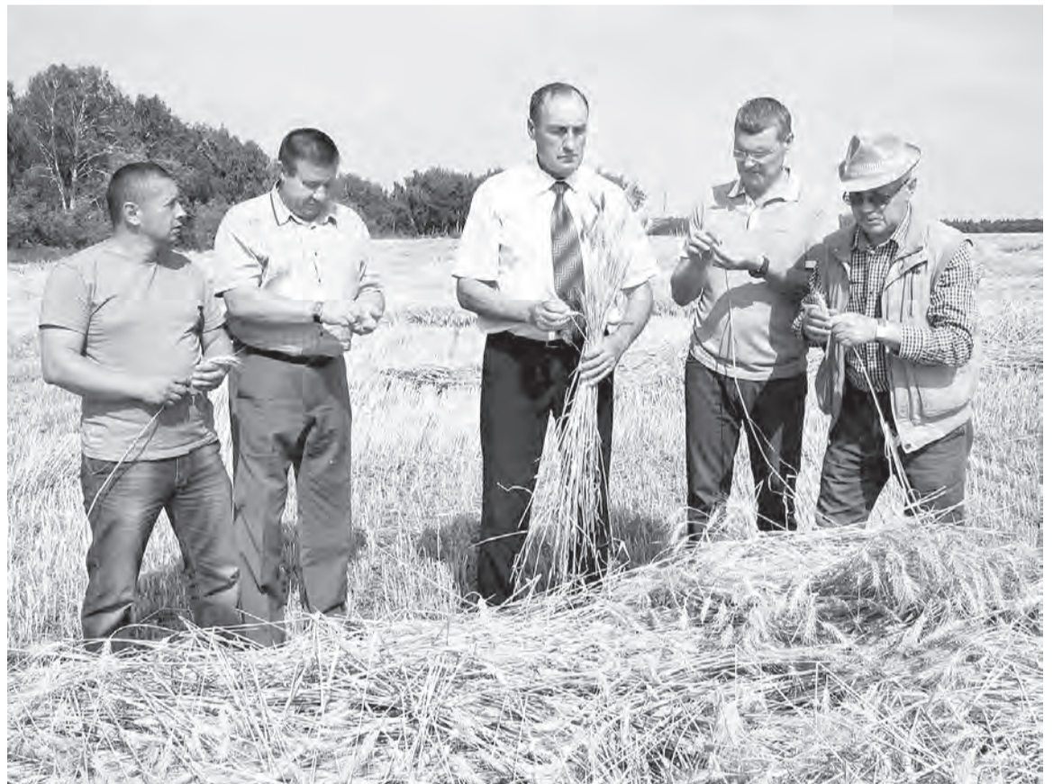
Оценка специалистов - отличный урожай.

- А начиналось весной 2014 года с одного центнера зерна, тогда еще и без названия, и полученных осенью 50 центнеров с гектара. В 2015-ом уже шесть