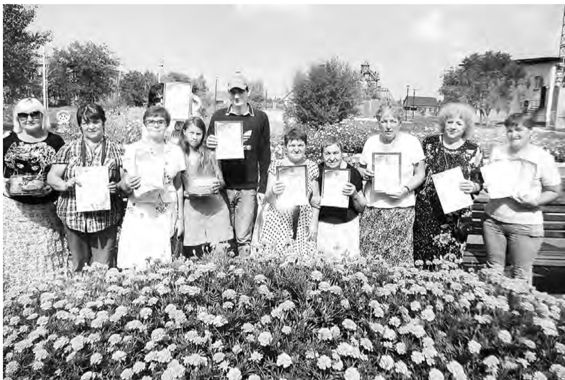
Они удостоились наград на районной выставке «Осенний вернисаж».