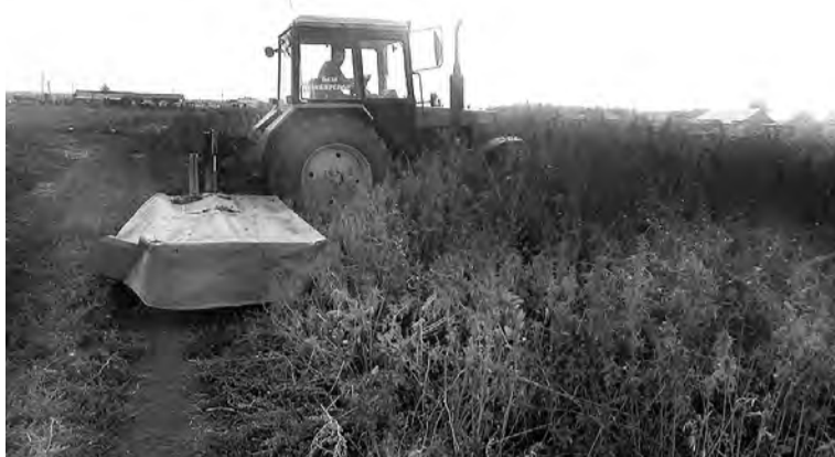
Идет уничтожение очагов произрастания дикорастущей конопли.

В ходе оперативно-профилактической операции «Мак-2017», задачей которой является выявление, предупреждение и раскрытие преступлений, связанных с незаконным оборотом наркотических средств растительного происхождения, на территории Боголюбовского сельского поселения близ деревни Шереметьевка сотрудниками ОМВД России по Марьяновскому району совместно с представителями КФХ «Новый труд» были уничтожены очаги произрастания дикорастущей конопли. А всего в нашем районе уничтожено более 10 тысяч кв.м аналогичных очагов.