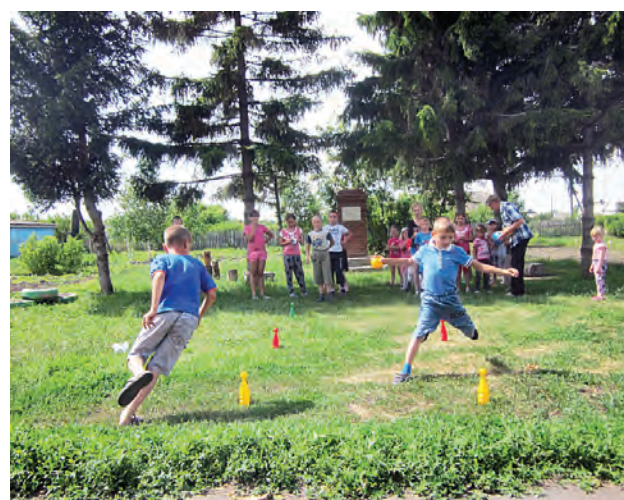
Подвижные игры на свежем воздухе по душе всем.