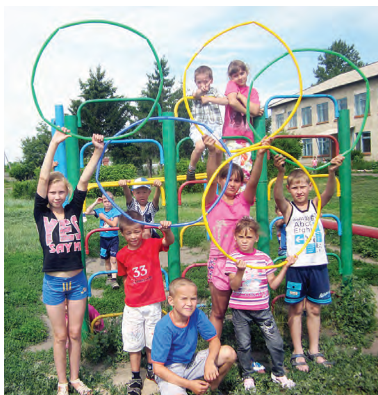
Усовские школьники обожают спорт и активный отдых.