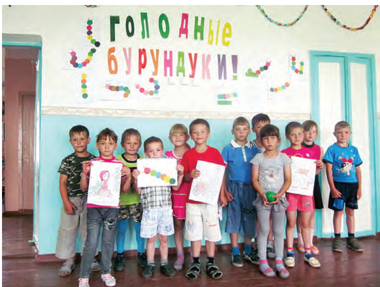
В первый отряд кроме будущих второклассников, входили и 18 дошколят.