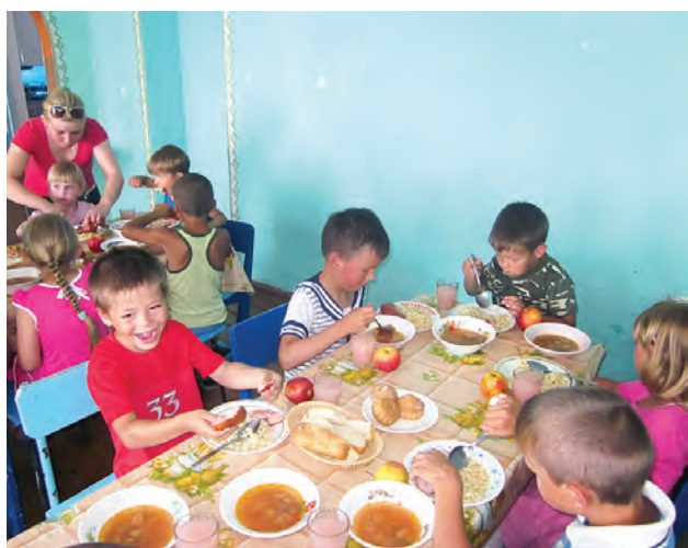
На обед у ребят были полезные и калорийные блюда.