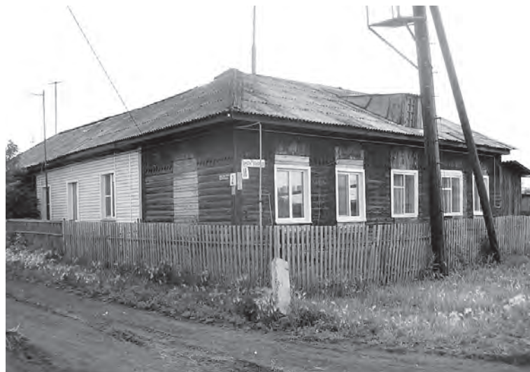
Бывший дом В. Шапошникова, в котором в первой половине XX века располагались волостной и районный исполнительные комитеты.