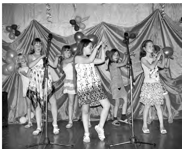
Зажигательный танец в исполнении девочек из первого отряда.