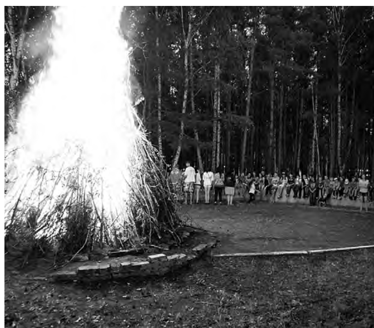
Когда зажгут костер, с нетерпением ждали все.