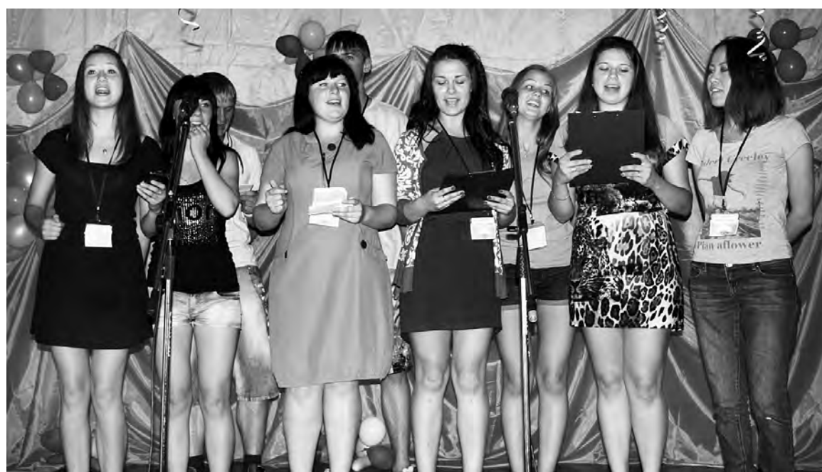
Своих воспитанников приветствовали песней вожатые.