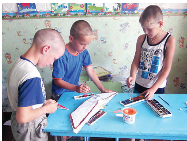
Отдыхая после шумных игр, можно и смастерить что-нибудь.