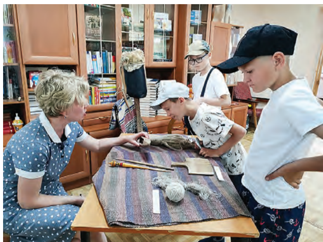
Старинные предметы быта заинтересовали даже мальчишек.