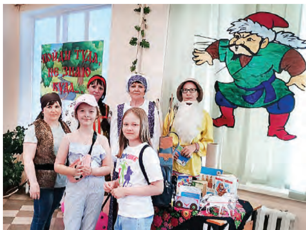
Судя по довольным детским улыбкам, праздник удался на славу!