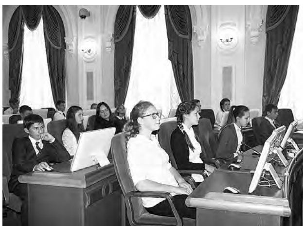
«Примерили» на себя депутатский статус.