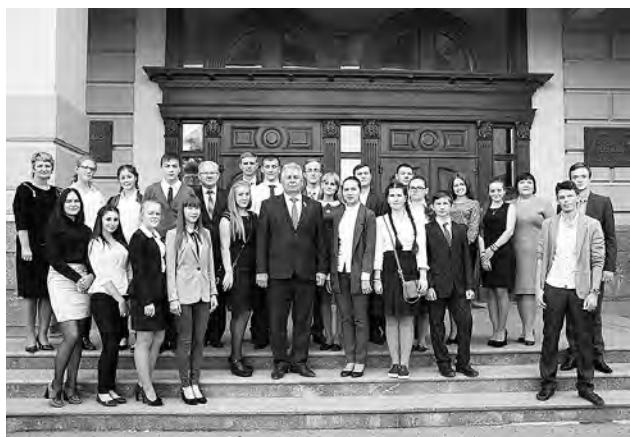
Учащиеся из Марьяновского района побывали в Законодательном Собрании Омской области.