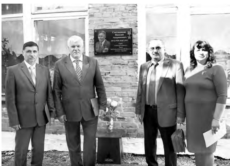
Мемориальная доска появилась на здании Шараповской школы в честь В. А. Сметанникова.

После окончания сельскохозяйственного техникума и