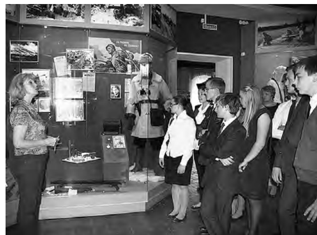
В Омском музее воинской славы.