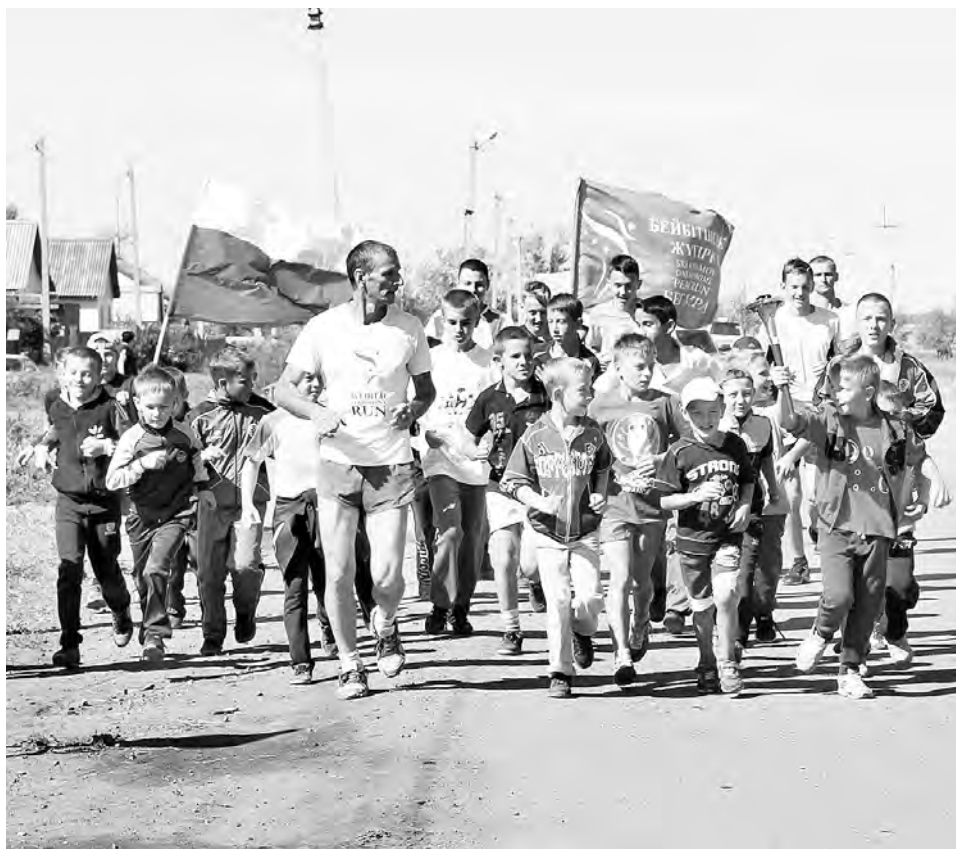
Бег мира на улицах Марьяновки.