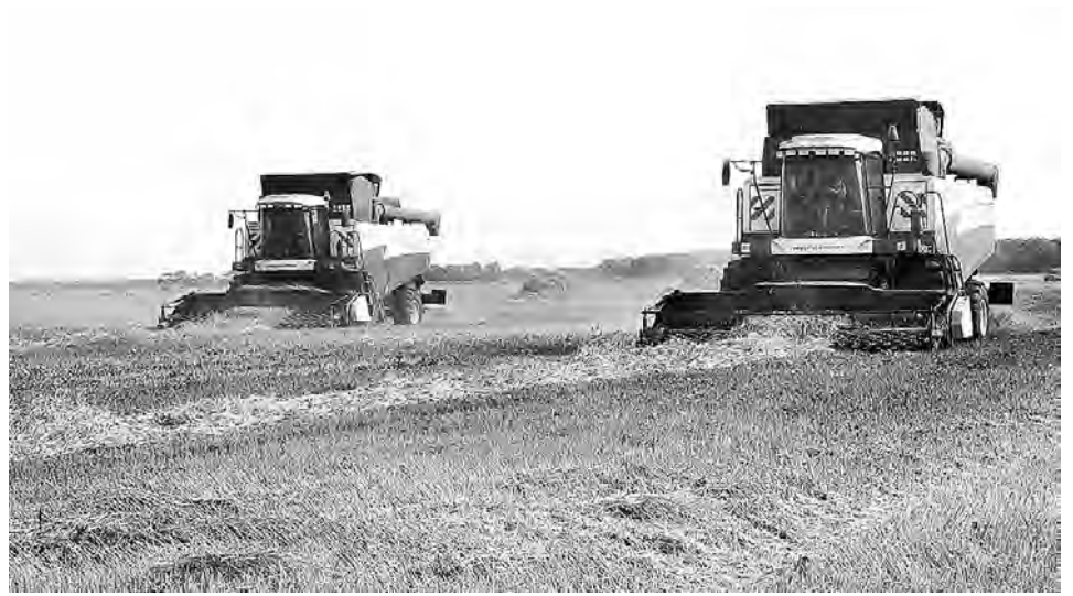
Новые комбайны на полях «Южного».