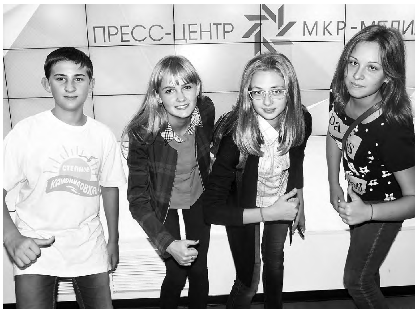
Юнкора из нашего района побывали в Доме журналиста и на телеканале «Продвижение».

Под таким названием реализуется в регионе программа сооружения спортивных площадок. Обустроена она была нынче и на территории Марьяновской средней школы №2, открыли которую первого сентября проведением «Веселых стартов» и баскетбольным турниром.