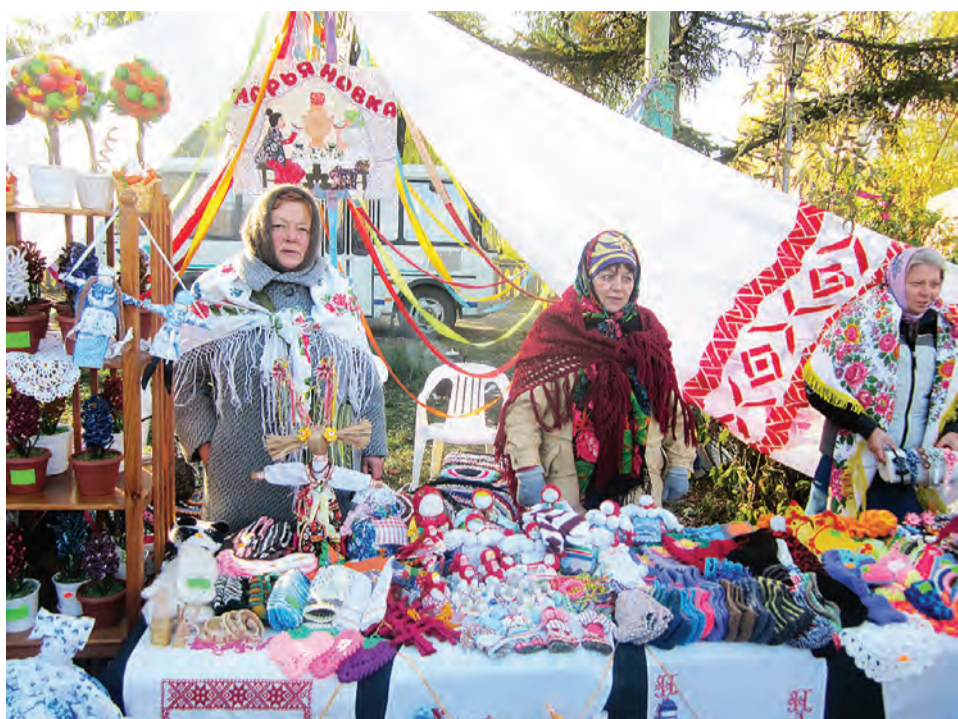
На прилавках марьяновцев - многообразие творений ручной работы.