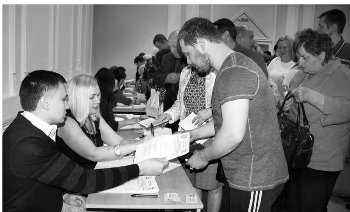
Момент получения выборщиками бюллетеней.