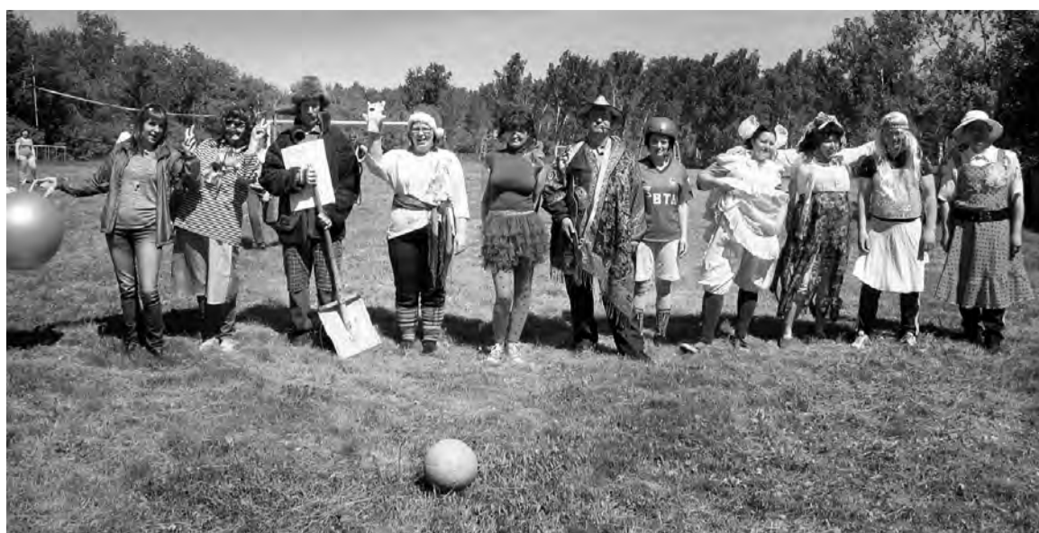
Вот такая нестандартная экипировка была у педагогов во время футбольного матча.