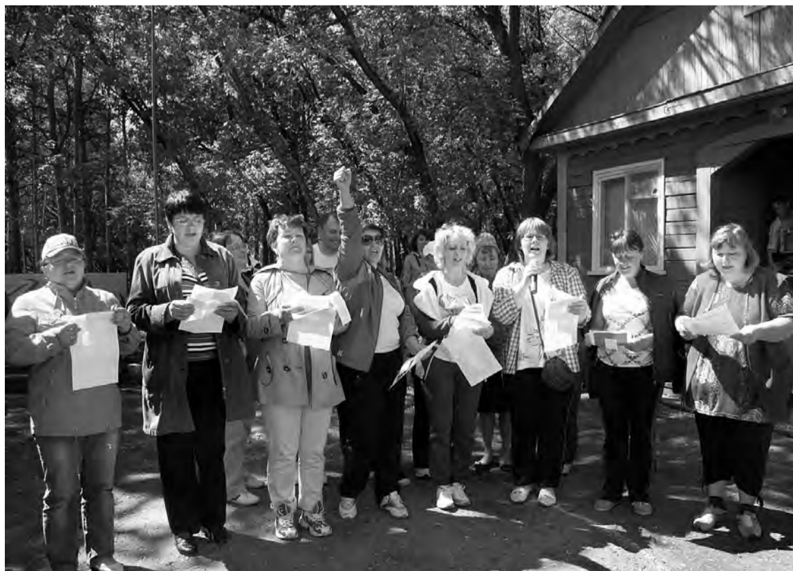
Приветствие активистов профсоюза Москаленской средней школы.

- Такие мероприятия не могут не нравиться. Они объединяют, сплочают. Делегация нашей школы поучаствовала в этом веселом, спортивном слете с большим желанием. Пусть он станет хорошей, позитивной традицией.