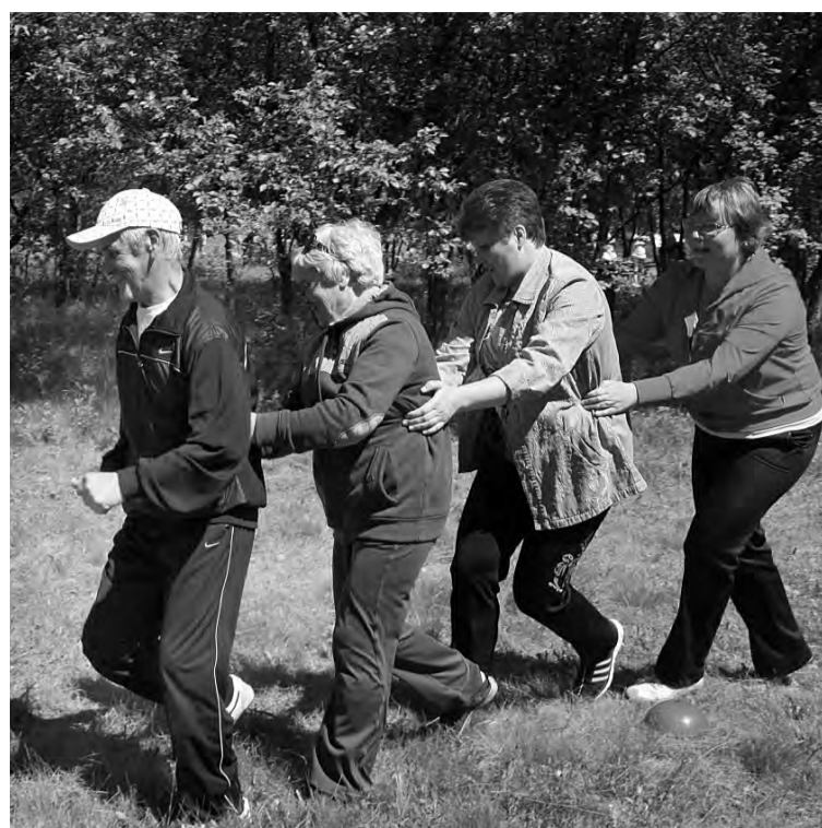
Азарту ветеранов педагогического труда можно было позавидовать!