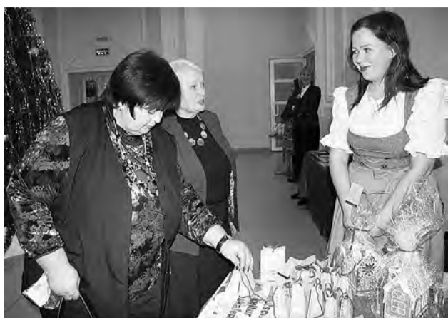
Центром немецкой культуры Москаленского района и поселка Конезаводский была организована выставка-продажа рождественских сувениров.