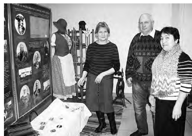
Специальная экспозиция Марьяновского районного краеведческого историко-художественного музея привлекала внимание и участников, и зрителей конкурса.