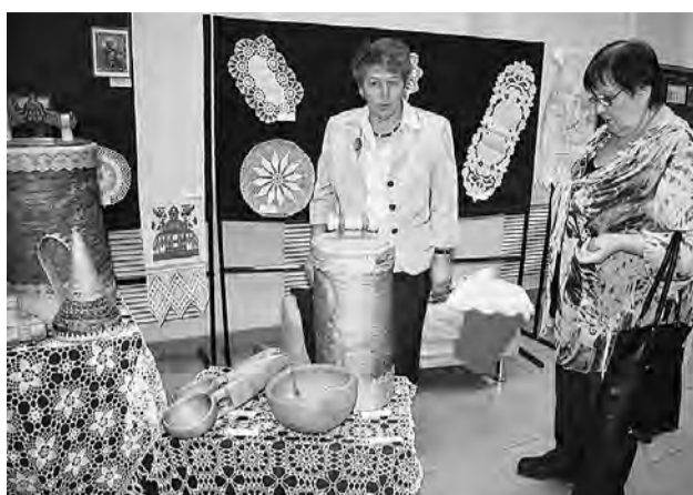
Выделялись работы участниц этнокультурного кружка декоративно-прикладного творчества «Мир женщин» Центра немецкой культуры р.п. Марьяновка.