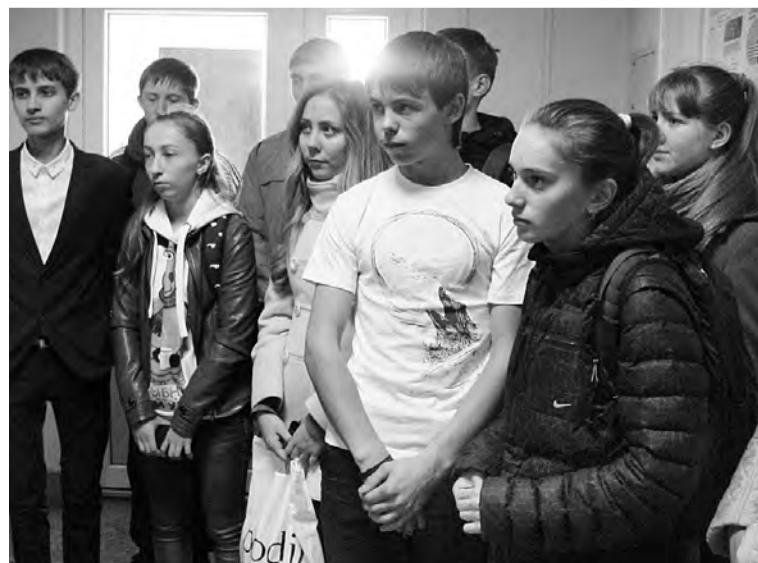
Старшеклассники Марьяновской средней школы №1.