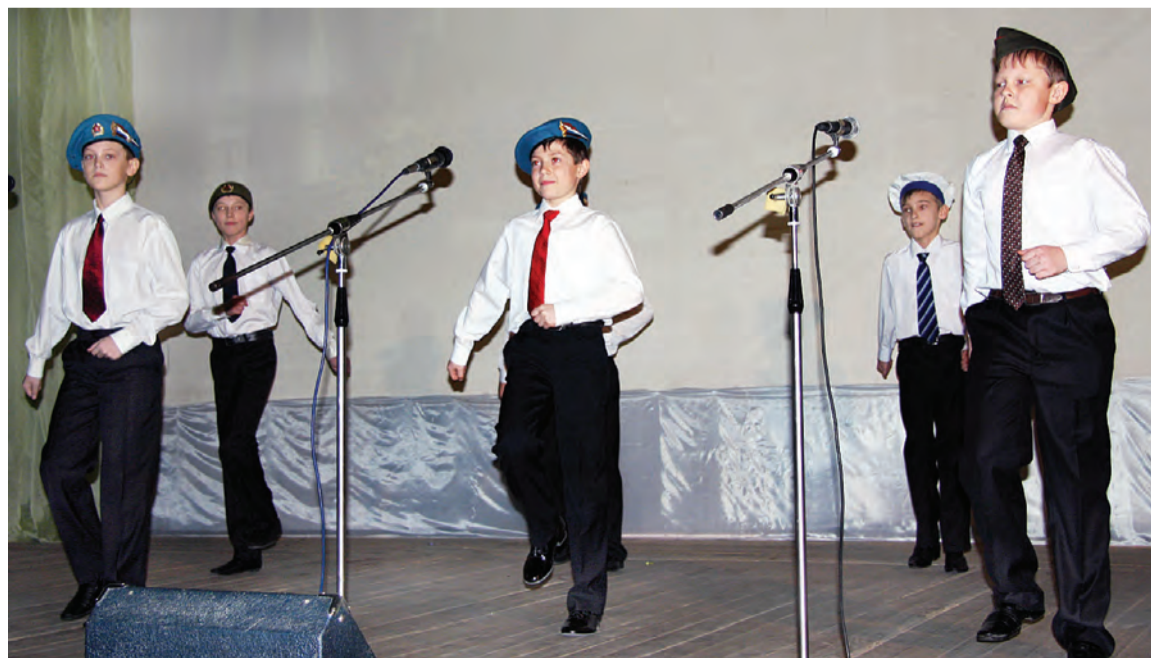
Приветствие юных марьяновских дарований.