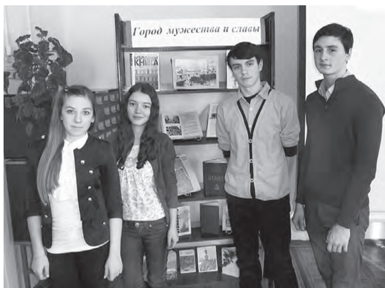
Учащиеся Марьяновской школы №1 на уроке мужества в библиотеке.