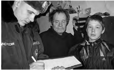
Идет обучение граждан мерам пожарной безопасности.

морегуляторов, предусмотренных конструкций. «Будьте осторожней и бдительней», - эту фразу повторяли специалисты каждому домовладельцу. Ведь именно каждый из родителей и взрослых членов семьи ответственен не только за свою жизнь, но и за жизнь своих детей и близких.