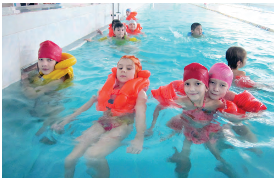
За окном трещит мороз, а здесь теплое водное раздолье.