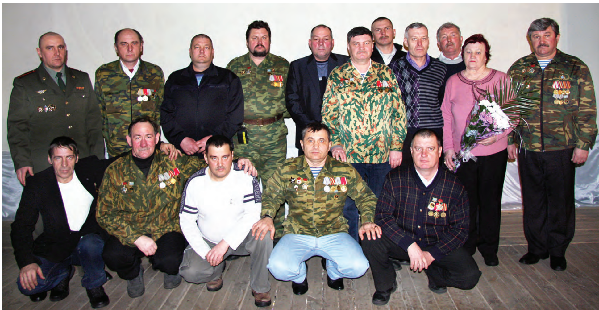
Участники памятной встречи, посвященной 25-летию вывода войск из Афганистана.