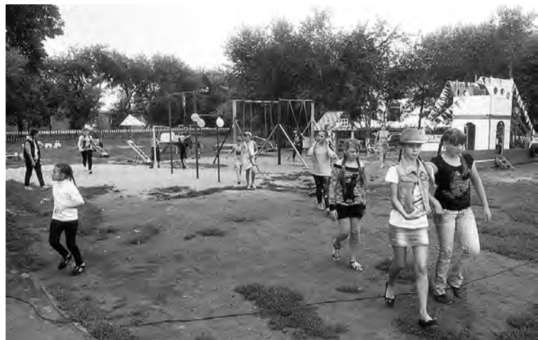
Проект «Организация семейного отдыха». Детская площадка в Степном.