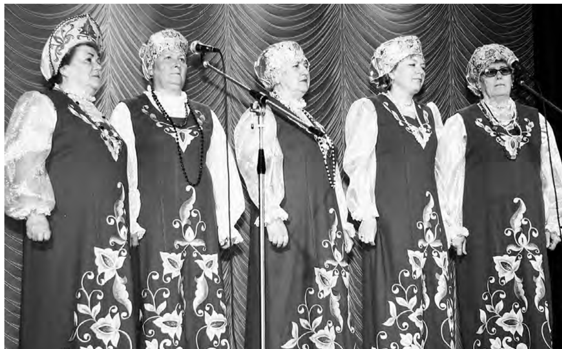
Вокальная группа «Сибирячка».