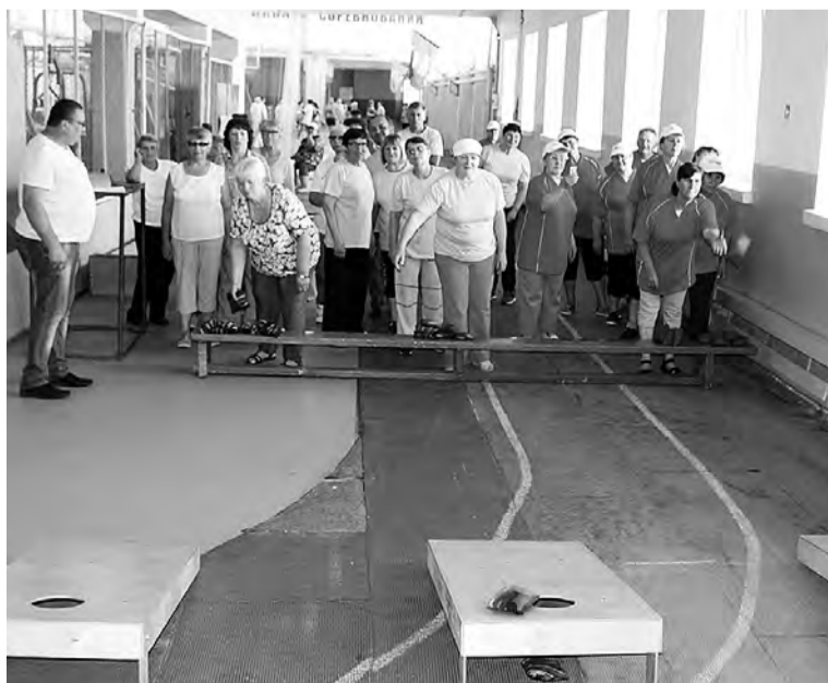
Один из захватывающих моментов конкурса.