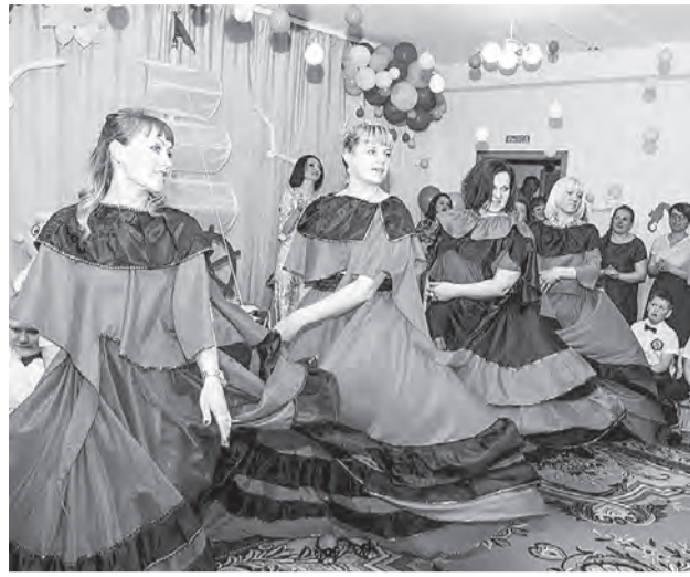
Зажигательно плясали и мамы малышей.