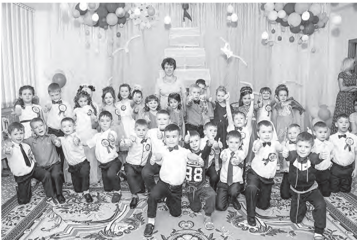
Выпускники Марьяновского детского сада №2.

Хочется от души поблагодарить и воспитателей группы, и весь коллектив дошкольного учреждения за высокий профессионализм в воспитании детей. Мы очень дорожим тем, что они делают.