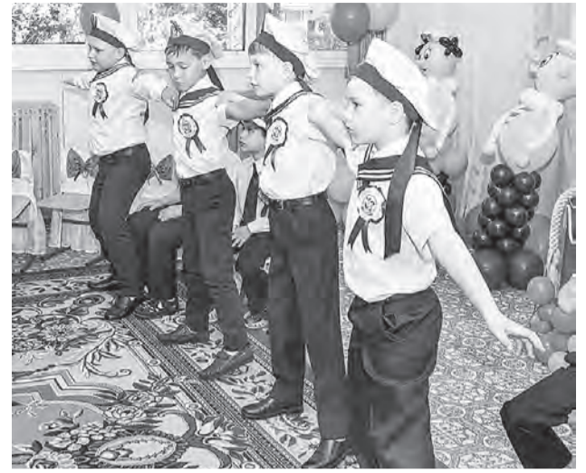
Бравый матросский танец.