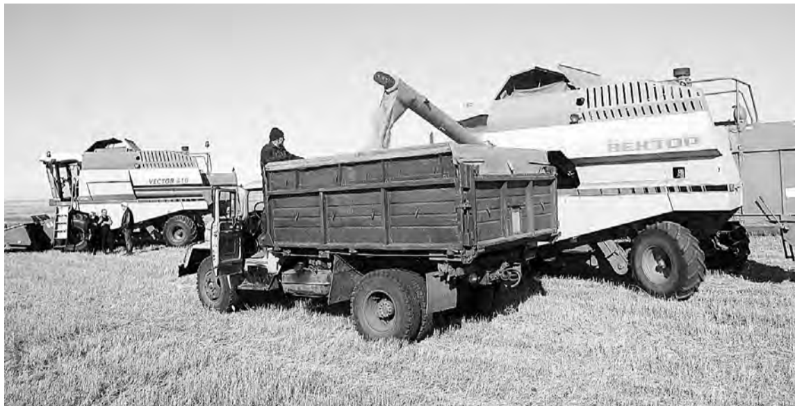
Сельхозтоваропроизводителями Омской области в прошлом году было высеяно более 30 тыс. тонн семян зерновых и масличных культур высших репродукций на площади 187 тыс. га.

В 2016 году в Омской области родились 26,3 тыс. детей (92,2 процен-