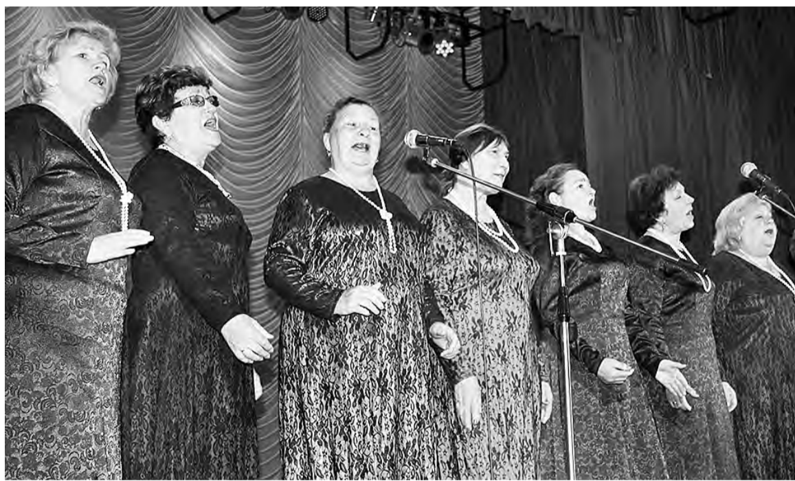
Звучит «Вальс расставания».

Среди задач фестиваля – популяризация лучших образцов вокально-эстрадного искусства 30-80-х годов XX века; возрождение и сохранение лучших отечественных и зарубежных традиций в области популярной музыки; активизация творческой инициативы, самореализация людей пожилого возраста и привлечение внимания молодежи к лучшим традициям вокального искусства советского периода; популяризация вокального жанра и выявление талантливых исполнителей; привлечение молодежи и людей активного возраста к творческому сотрудничеству с общественной организацией ветеранов; обмен опытом между творческими коллективами и исполнителями; организация досуга ветеранов и населения Марьяновского района.