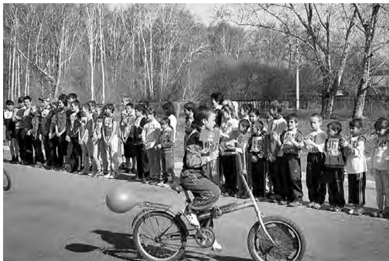
Проект «Кросс Победы». Деревня Большая Роща.