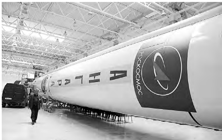
На базе Производственного объединения «Полет» – филиала ФГУП «ГКНПЦ имени М. В. Хруничева» продолжена реализация проекта по созданию серийного производства универсальных ракетных модулей ракет-носителей семейства «Ангара».

Продолжена реализация комплекса мер по поддержке молодежного добровольчества. В регионе действуют около 600 добровольческих организаций, объединяющих более 10 тыс. волонтеров. В целях патриотического воспитания организовано участие молодежи во всероссийских акциях, среди которых «Свеча памяти», «Георгиевская ленточка», молодежные исторические квесты, посвященные основным событиям Великой Отечественной войны.