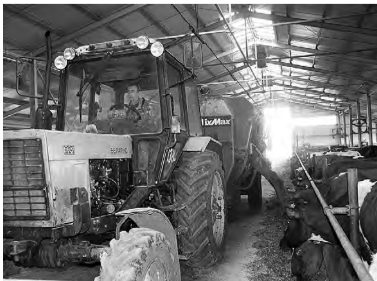
Процесс раздачи паточки высокопродуктивным коровам.