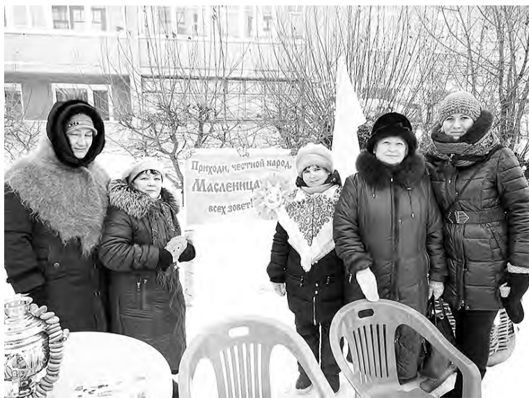
Работники библиотек – участники самых разных мероприятий и Масленицы в том числе, которая нынче начнется с 12 февраля.