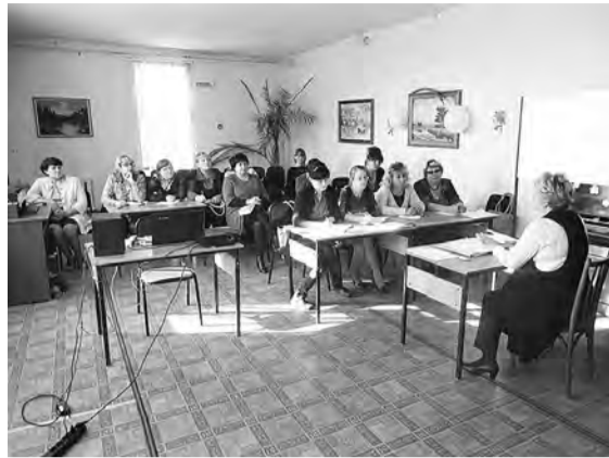
Библиотеки активно посещают дети и взрослые общаются в клубах по интересам.