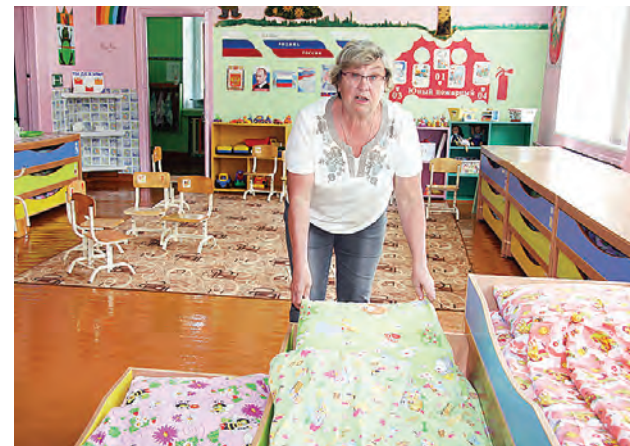
Новинка Орловского детсада - трехъярусные кровати.