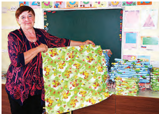
Степнинский детский сад обеспечил себя новым постельным бельем.