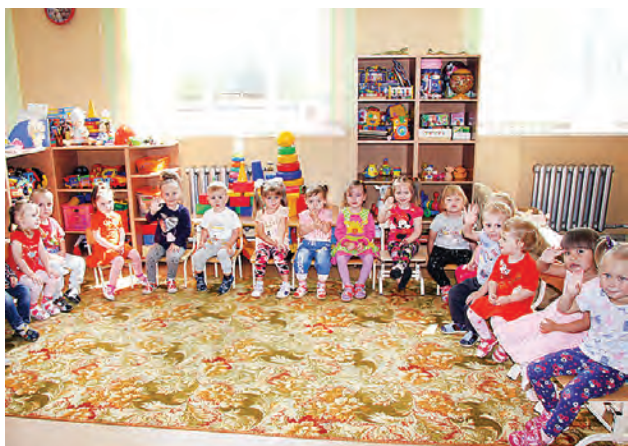
И с настроением, и с желанием посещают малыши дошкольные учреждения в нашем районе.