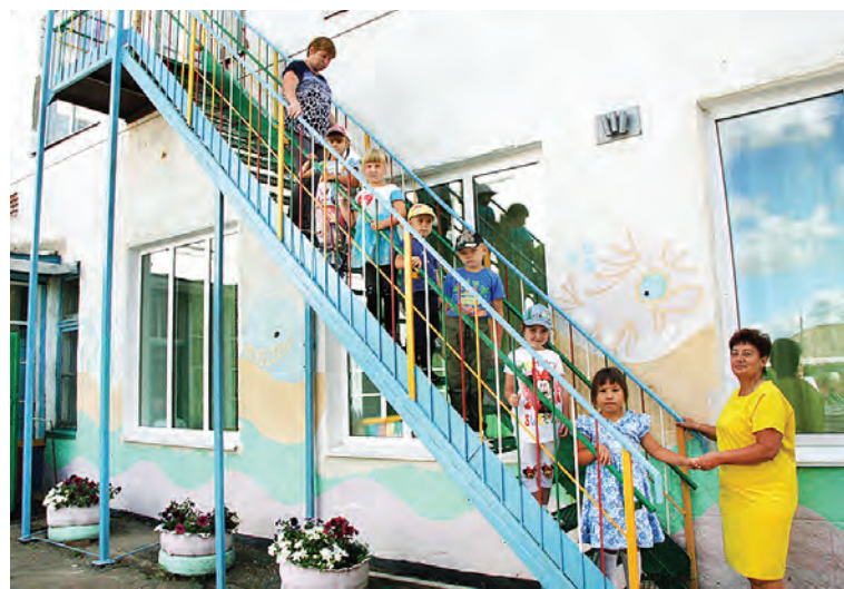
Фрагмент тренировочной эвакуации детей в Марьяновском детском саду №3 в один из августовских дней.