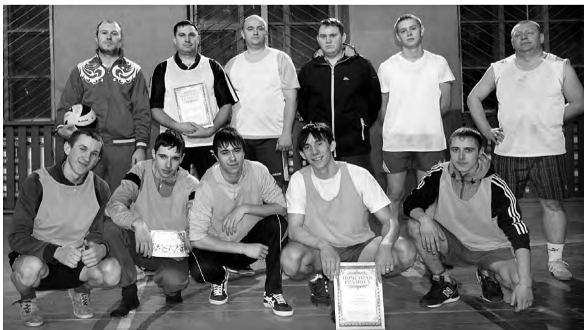
Товарищеский волейбольный матч мотивировал стать сильнее.