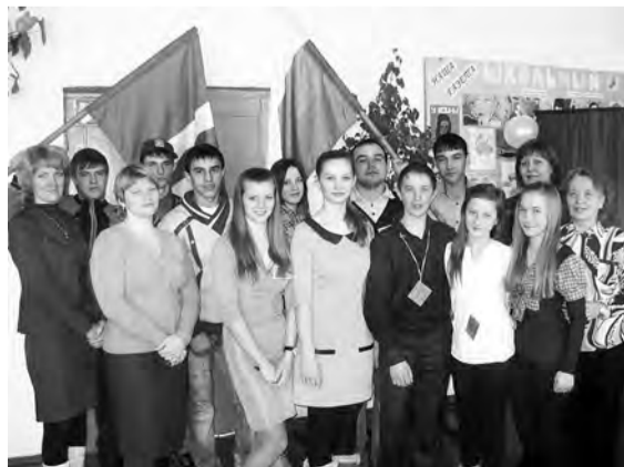
Выборы первого президента школы.