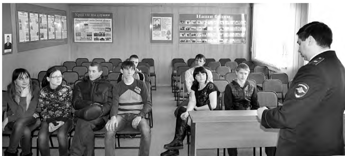
К профессии полицейского студенты колледжа проявили нешуточный интерес.