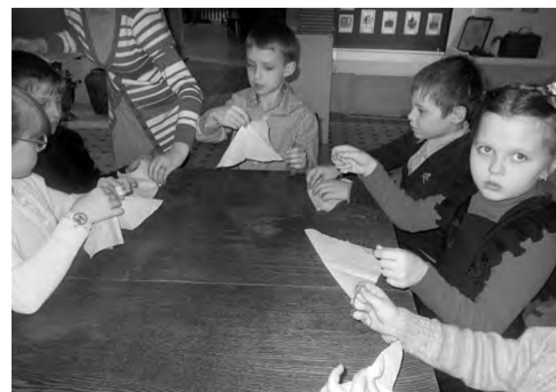
Мастер-класс по изготовлению рождественского ангела.