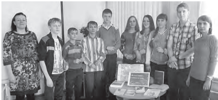
На уроке мужества, посвященном снятию блокады Ленинграда, побывали старшеклассники Марьяновской средней школы №2.